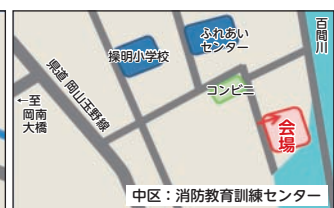
消防教育訓練センター （中区桑野）