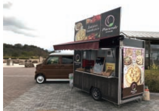
平成31年度 観空産業(株) 「まやかみフルーツを有効活用した地区農業の活性化」