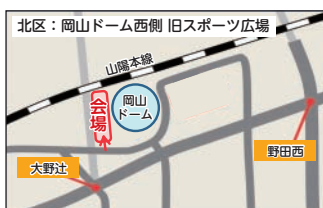
岡山ドーム西側 旧スポーツ広場 （北区北長瀬表町一丁目）