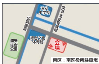
南区役所駐車場 （南区浦安南町）