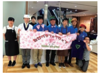
平成31年度 たけべカフェグロップ 「建物つながる魅力プロジェクト」