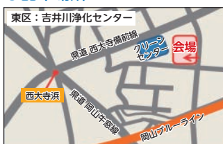
吉井川浄化センター （東区西大寺新地）