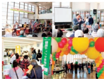
▲「なかまちーずフェスティバル」の様子

また、「なかまちーず」のメインイベントの一つである「なかまちーずフェスティバル」は、例年3月末に岡山ふれあいセンターで実施しており、多くの人にご来場いただいています（令和元年度は新型コロナウイルスの影響で中止）。