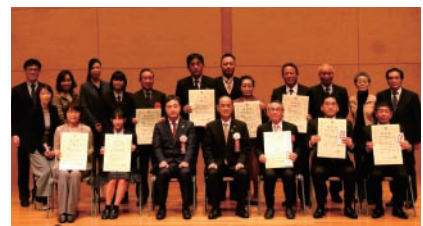
▲まちづくり賞表彰式の様子

住民自治組織、NPO、企業、学校、行政など多様な主体が協働で行う、テーマに沿った地域の社会課題解決に関するもの