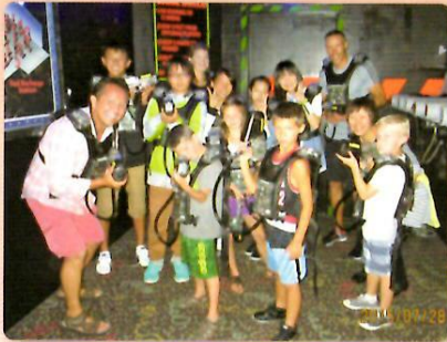
ホームステイファミリーとの交流