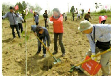
洛陽緑化事業の記念植樹