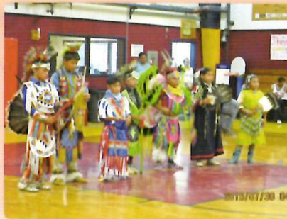
ウマティラ青年部族の伝統的な踊りを観賞