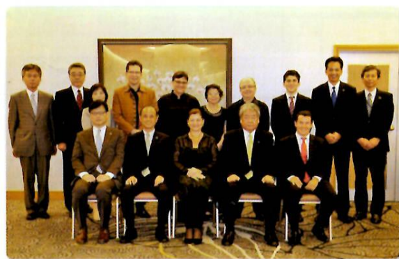
市長・市議会議員を表敬訪問