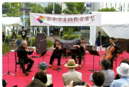
おかやま国際音楽祭 2015 オープニングコンサート