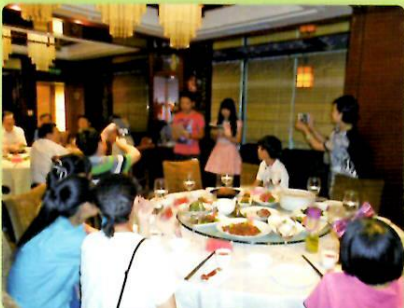
洛陽市主催歓迎夕食会