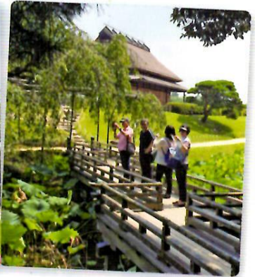
岡山城・岡山後楽園見学