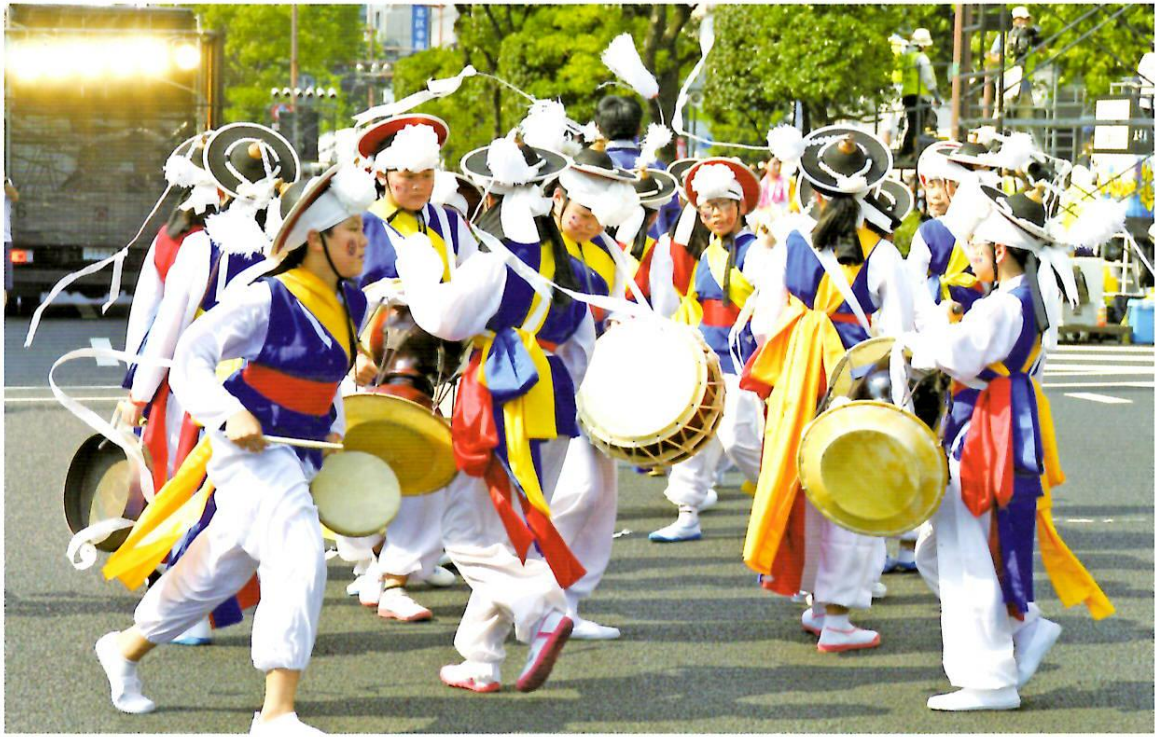
「おかやま桃太郎まつり」うらじゃパレードに参加する富川市公演団（富川 よつがる 如月小学校）の子どもたち