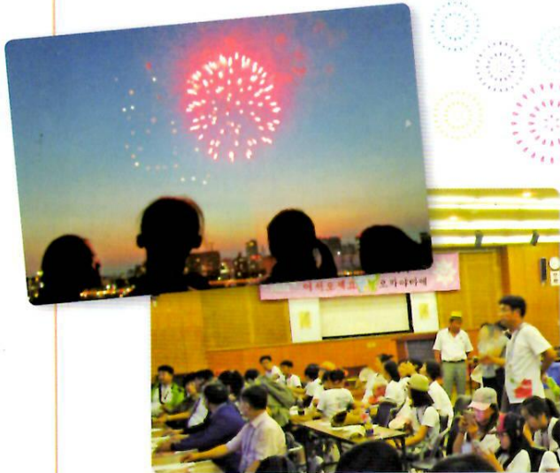
「おかやま桃太郎まつり」納涼花火大会を視覧