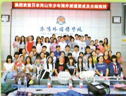
洛陽外国語学校との交流会