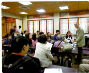
中華大学の学生との交流

横山忠弘副市長、宮武博岡山市議会議長をはじめとする総勢35名の「岡山市民友好親善訪問団」・「岡山市・新竹市友好都市議員連盟訪問団」が台湾・新竹市を訪問しました。一行は、新竹市主催の歓迎レセプションや中華大学日本語学科の訪問で交流したほか、台北市では太極拳の文化体験などを通じて、台湾・新竹市への理解を深めました。（10月28日～31日）