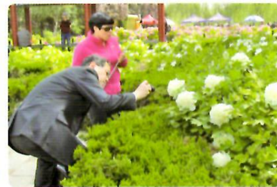
中国国花園にて牡丹祭りを見学