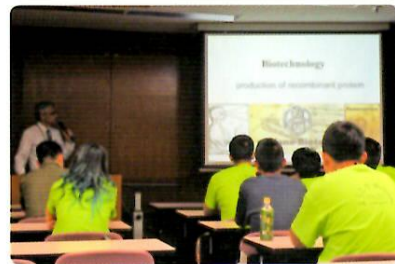
岡山大学にて講義を聴く