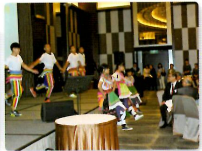
新竹市主催歓迎レセプション