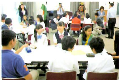
岡山学芸館清秀中学校の生徒との交流

アメリカ合衆国・サンノゼ市の学生11名が来訪し、施設見学や市内の学校・ホームステイ受入家庭との交流を行いました。（6月17日～22日）