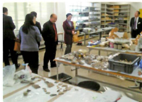
岡山市埋蔵文化財センターを視察

洛陽市文化財視察訪日団一行6名が来訪し、岡山市埋蔵文化財センターや岡山城石垣修復現場などを視察しました。（12月7日～8日）