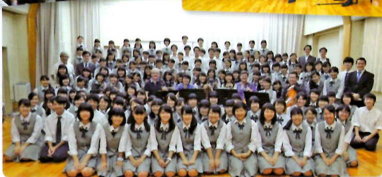
岡山城東高等学校生徒との音楽交流