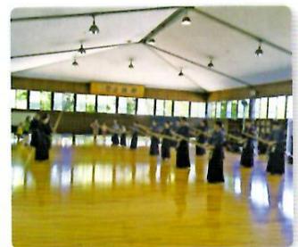
市内の剣道団体と交流

昨年に引き続き、新竹市剣道協会一行（26名）が来訪。市内学校の剣道部や剣道団体との練習を通じて日本の剣道文化や精神を学ぶとともに、お互いに土産交換や質問をするなどして交流を図りました。（7月25日～8月2日）