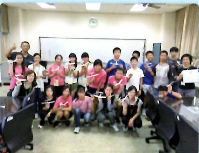
新竹市立建華国民中学校の生徒と交流