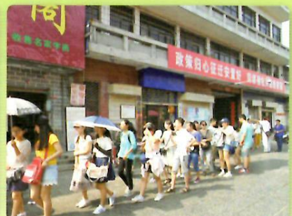
老城区（洛陽旧市街）散策