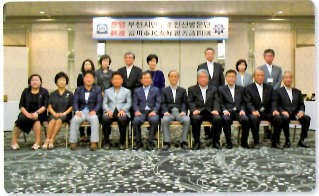
市長・市議会議長を表敬訪問

富川市代表団、富川市議会議員団ら9名、如月小学校の子どもたちを含む公演団（うらじゃ連）39名により構成される富川市民友好親善訪問団が来訪しました。岡山市長・岡山市議会議長の表敬訪問や、歓迎夕食会などの公式行事の他、「おかやま桃太郎まつり」の納涼花火大会を視覧し、うらじゃパレードに参加しました。（7月31日～8月4日）