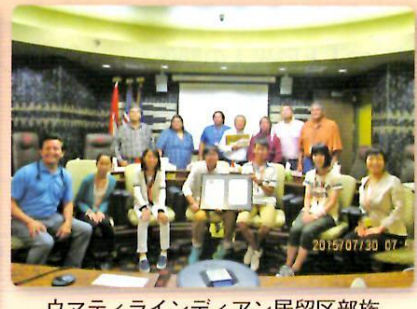
ウマティラインディアン居留区部族連合評議会委員長を表敬訪問