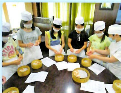
小籠包・ビーフン作りに挑戦