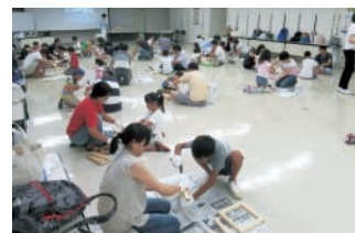
▲昨年の講座の様子

新型コロナウイルスの影響によりイベントが中止などになる場合があります。詳細は各施設にお問い合わせください。