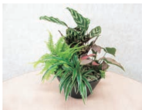
A おしゃれに飾る観葉植物の寄せ植え