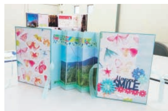
スクラップブック

☎ 8月29日(土)10時～12時 (対) 5歳～小学生と保護者 (定) 8組程度 (費) 1組500円程度 (申) 8月19日までに