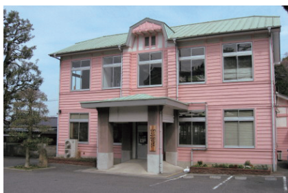
(※現在は外に囲いがありません。)

現在の児島地域センターの庁舎の歴史は古く、甲浦村役場として建築された昭和6年までさかのぼります。昭和27年の岡山市との合併後も今なお現役（築後89年）であり、大きな蔵を備えた木造2階建て、淡いピン