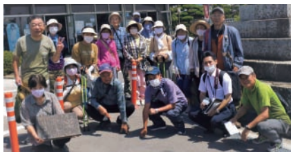
▲沖新田八十八カ所納札巡り案内図の原版とウォーキング参加者

公民館、西大寺公民館、操南公民館、東区役所総務・地域振興課にも置いてありますのでご利用ください。