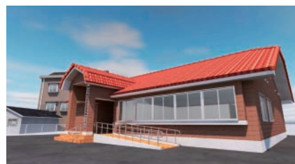
(新地域センター・イメージ図) ・鉄骨造平屋建 ・延べ面積約230m 2

今後とも、現庁舎同様に親しみやすく、気軽に利用できる市民サービス拠点となることを目指してまいります。