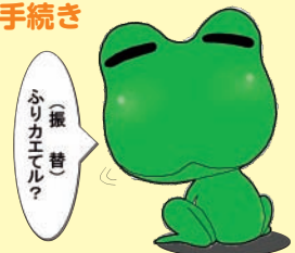
口座振替PRキャラクター 「ふりカエル」

専用はがき(料金課・各区役所・支所・地域センターなどに設置)に必要事項を記入・押印し、料金課へ郵送。