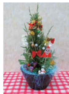
A 親子でクリスマス寄せ植え