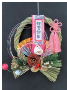
A しめ縄リースづくり