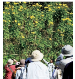
B 四季と自然を楽しむ会