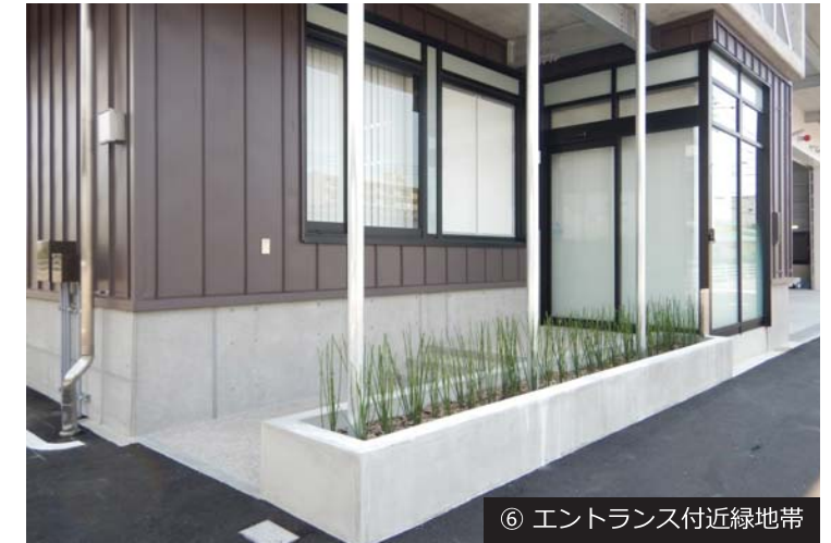
⑥ エントランス付近緑地帯