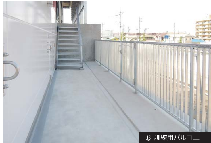
⑬ 訓練用バルコニー