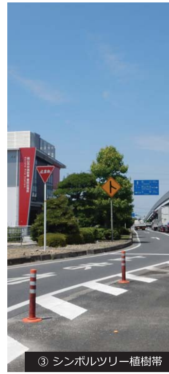
③ シンボルツリー植樹帯