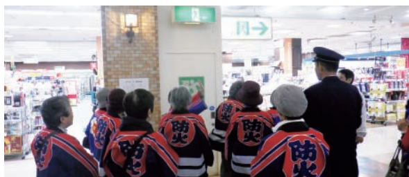
▲商業施設での普及啓発活動の様子

同クラブでは、住宅用火災警報器設置の普及啓発や、非常食についての研修会開催などさまざまな活動を行っています。また、このような活動を通じて、地域の中でお互いに顔の見える関係を構築することで、災害時における連携強化も図っています。