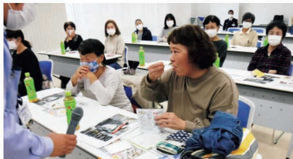
▲非常食研修会の様子

南海トラフ地震などの大規模災害が起こった際には、公的機関が行う公助だけでは充分に対応できないと言われています。その時に大切になってくるのが「自分の命は自分で守る」という自助、「地域の人と共に助け合う」という共助です。