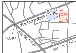
吉井川浄化センター (東区西大寺新地)