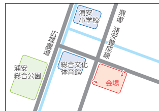
南区役所駐車場 (南区浦安南町)