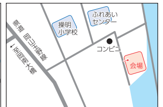
消防教育訓練センター (中区桑野)