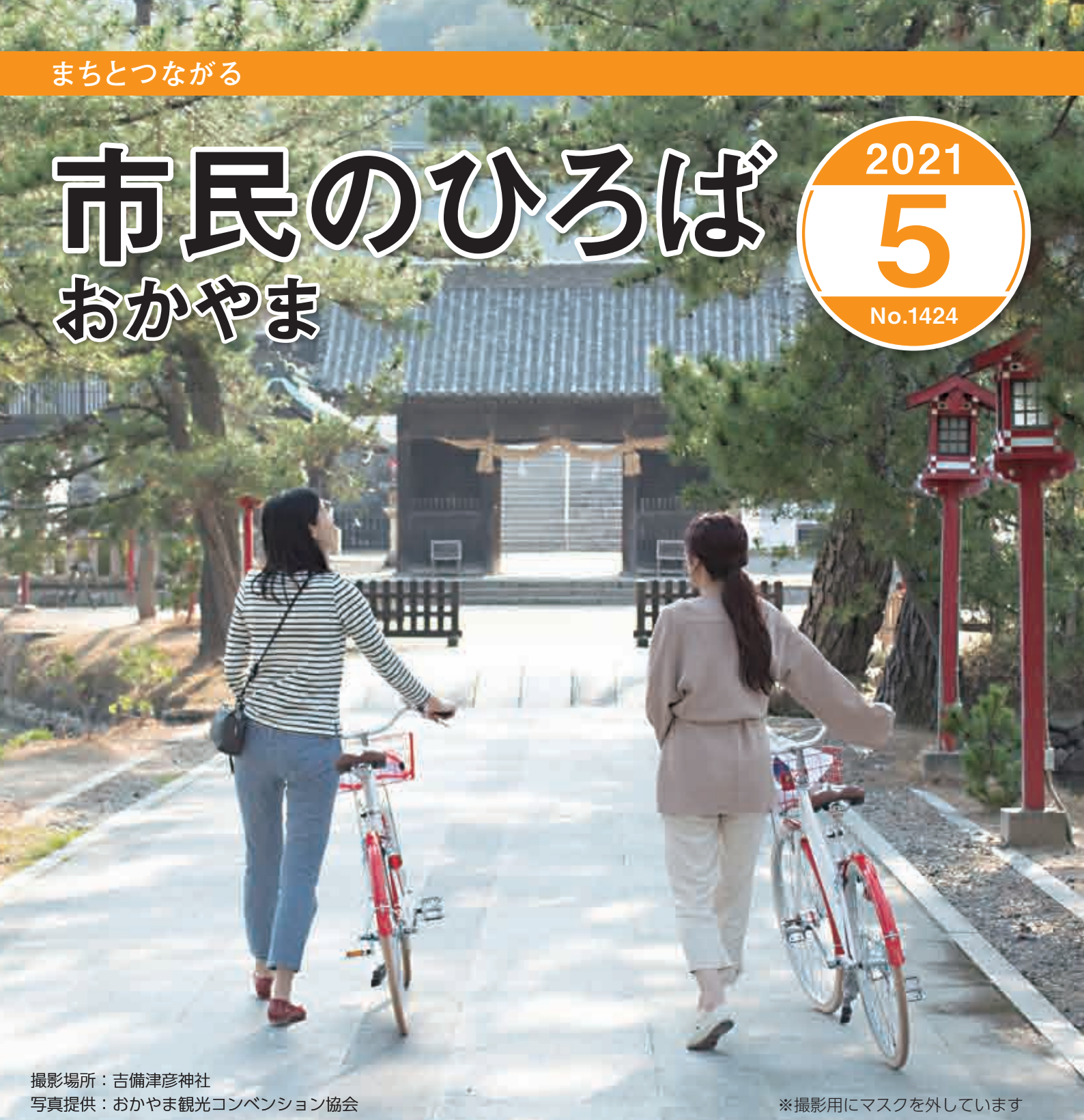
撮影場所：吉備津彦神社