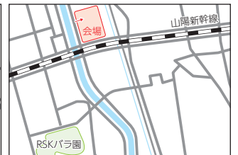
撫川公園 (北区中撫川地内)