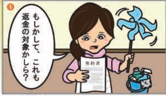
掃除をしていると・・・？