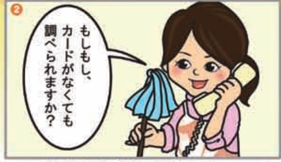
ダメ元で電話してみたら・・・