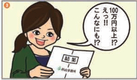
まさかの過払い金が!!