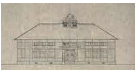
藤田尋常小学校講堂の設計図(正面図) 岡山市立中央図書館蔵