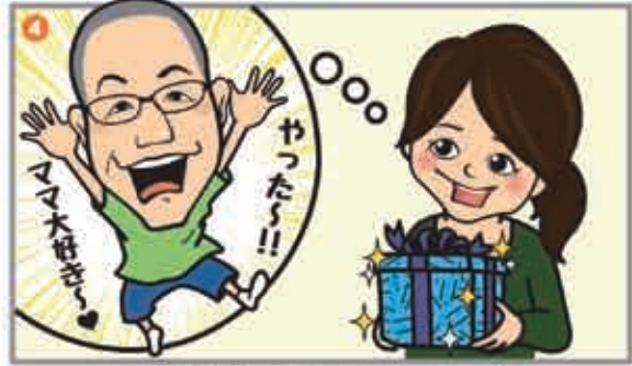
相談してよかったっ!