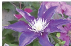
【A】クレマチスの楽しみ方