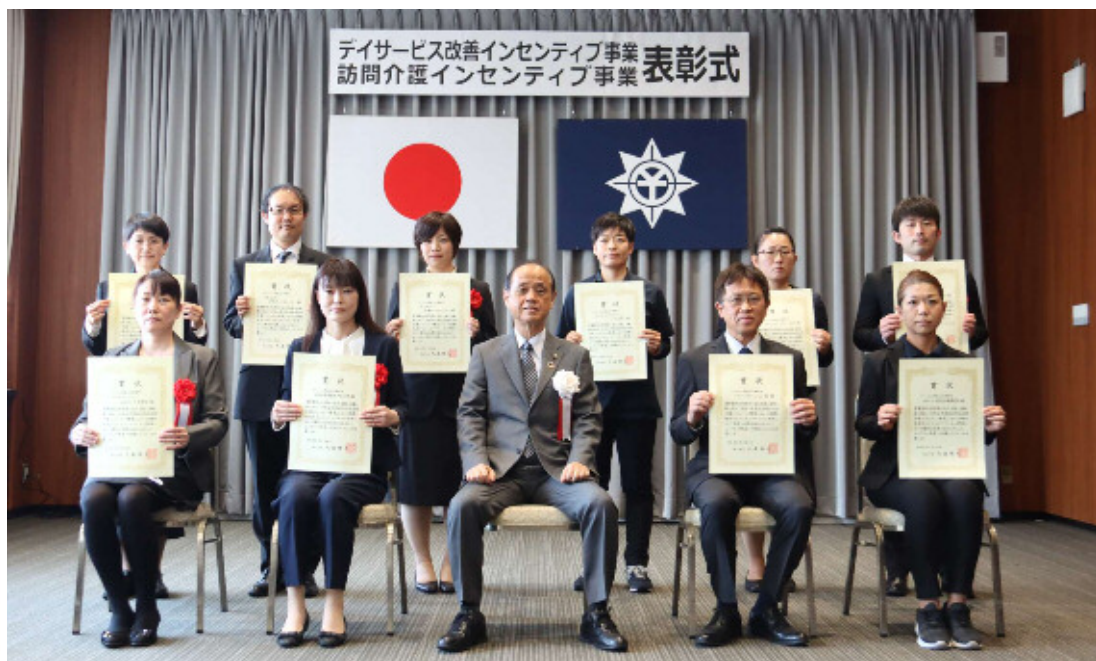
訪問介護インセンティブ事業