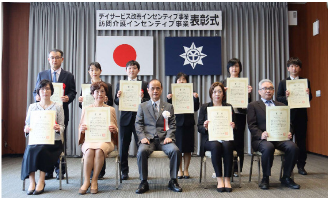
デイサービス改善インセンティブ事業