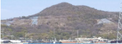
芥子山が綺麗に見える立地