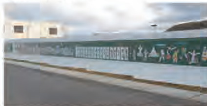
▲工事現場の塀を彩る作品