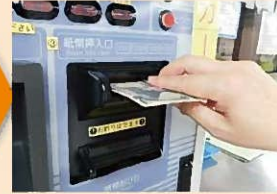
入金する紙幣を挿入口に入れます