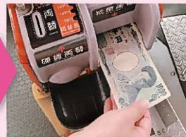
入金する紙幣を挿入口に入れます