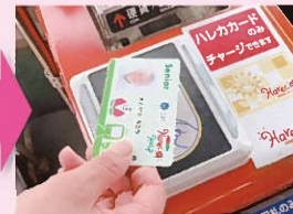
再度、降車口のカードリーダーにタッチします