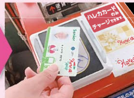
降車口のカードリーダーにタッチします