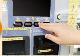
入金する金額のボタンを押します