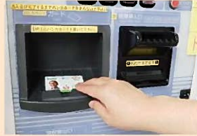
自動積増機にハレカを置きます