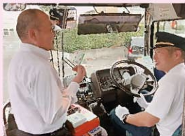
乗務員に入金する金額を告げます

車内でのスムーズな乗降や運行の定時性確保のためにも、 窓口や自動積増機での事前のチャージにご協力ください