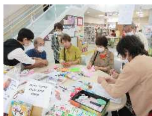
体験ブース (韓国語 [折り紙]、上道ボランティア部 [バルーンアート])