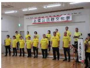
舞台発表 (岡山合唱団、3B体操・ジュニア3B体操、上道ソシアルダンス、ホイホイフラ)