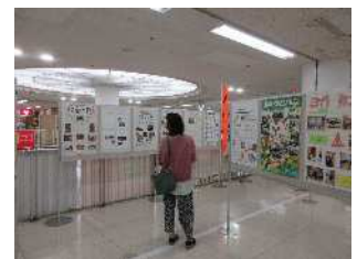
ゆめタウンでは、クラブ活動紹介の掲示を行いました