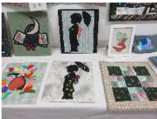
作品展示 (キルト手芸、洋裁、日本画、絵手紙)

★10月5日～6日、12日～13日の2期に分けて、公民館で作品展示や舞台発表を中心として、クラブ活動の成果発表を行いました。その一部をご紹介します。