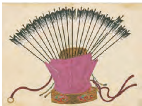
▲胡籐図（岡山大学附属図書館所蔵）