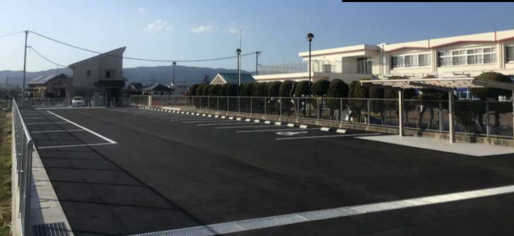
②外観（駐車場・駐輪場）