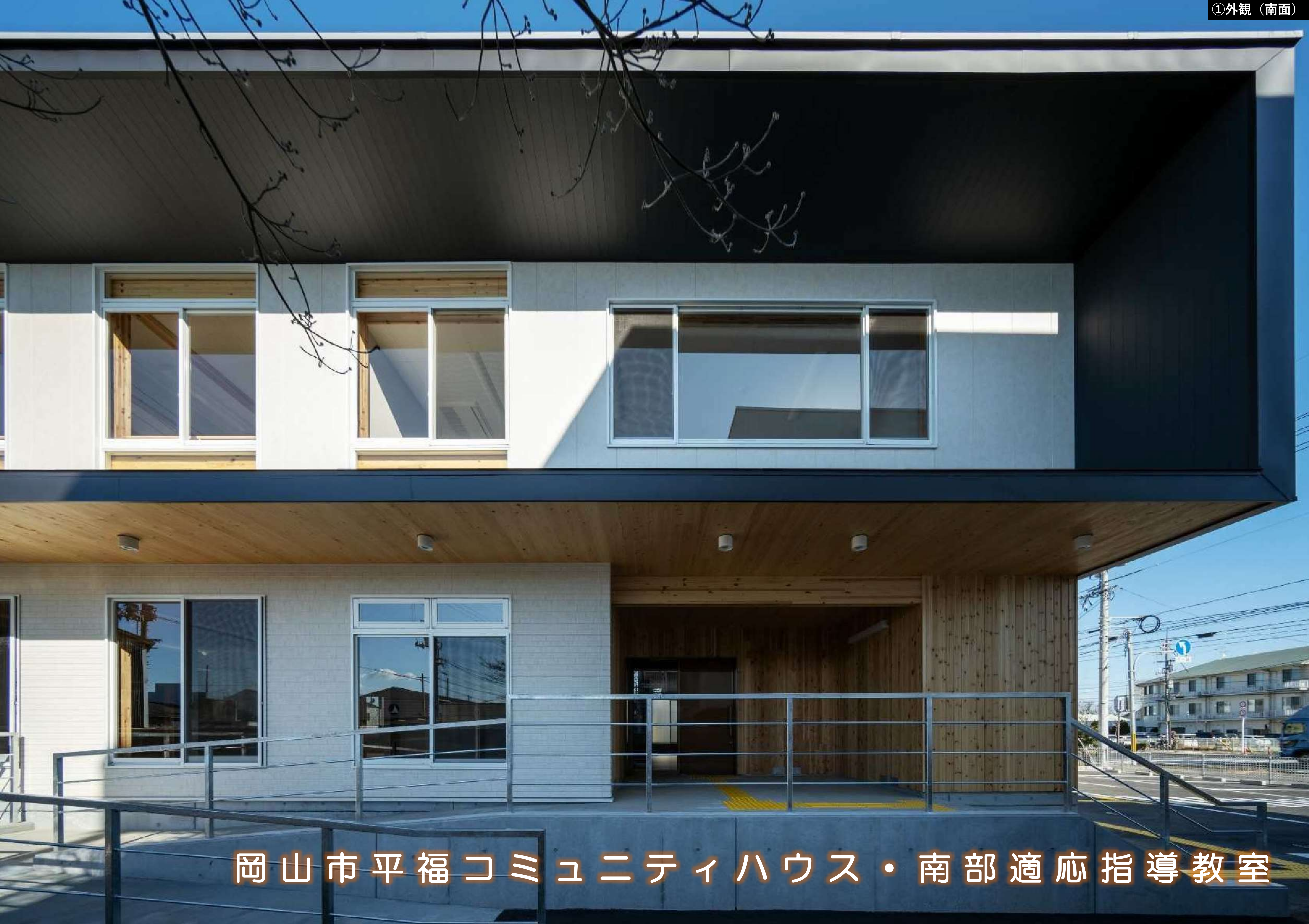
岡山市平福コミュニティハウス・南部適応指導教室