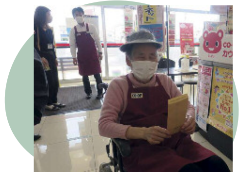
写真上：工場から受注した、商品のラベルカット作業。「タバコ代になる」と喜ぶ利用者。写真下：コープ草取り後、手にした有償ボランティア代でお菓子購入。

我々の役割として、この方のひっかかりを改善したいけれど、どうにもならないもどかしさがありました。ですので、