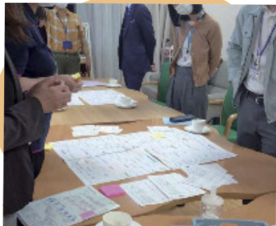
写真上: 利用者へ「ハタラク」の希望を聞き取るスタッフ。写真下: 集めた地域情報を地図にまとめて共有している。

新しいことを始めることが大好きな組織なので、利用者さんのためになることはやろうと決めました。2021年の介護報酬改定で通所介護の地域交流が努力義務化されたこともあって、組織の年度目標に地域活動の積極的推進を掲げた頃、岡山市から「ハタラク」説明会のメールが来たんです。楽しそうだし、やってみよう! と即決でした。