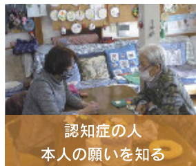
認知症の人 本人の願いを知る