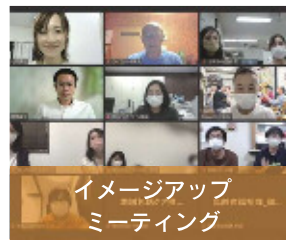
イメージアップ ミーティング