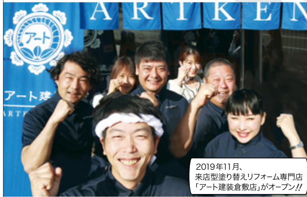
2019年11月、来店型塗り替えリフォーム専門店「アート建装倉敷店」がオープン!!