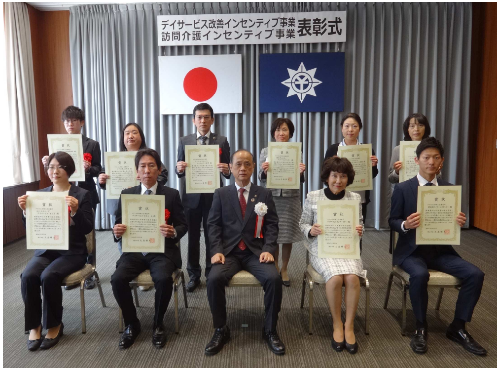
サービス改善インセンティブ事業