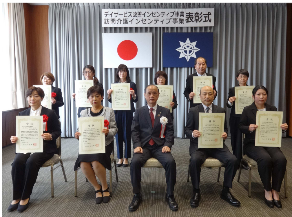
訪問介護インセンティブ事業