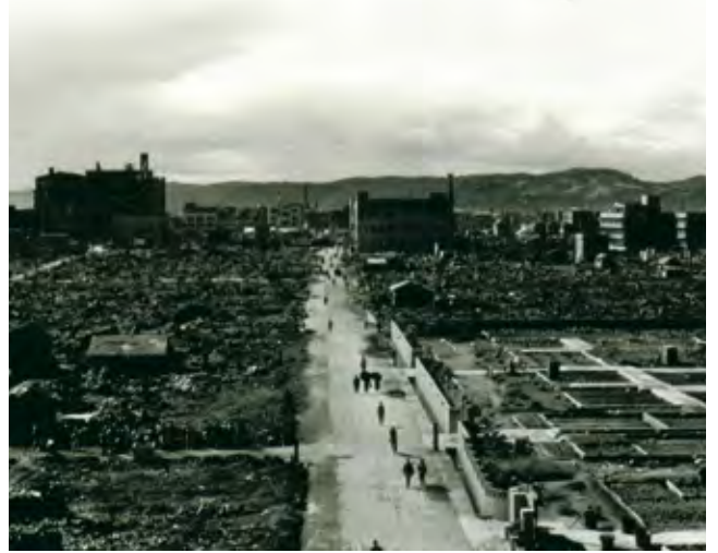
現在の県庁付近から西を見る

名簿は福祉援護課で閲覧できます。引き続き名簿の整備を進めていますので、親族や知人に岡山空襲に関する戦災死者がいる場合は、情報提供をお願いします。