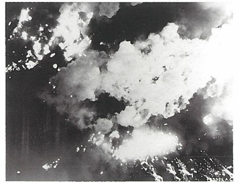
空襲される岡山市街地 1945年6月29日