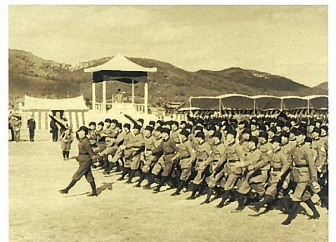
警防団防空空隊の分列式 1942年11月29日

※チラシ表面の写真 (中央) 空襲から4分後を指したまま止まった腕時計 (背景) 岡山市公会堂（現・県庁付近）から西を見る 1945年10月