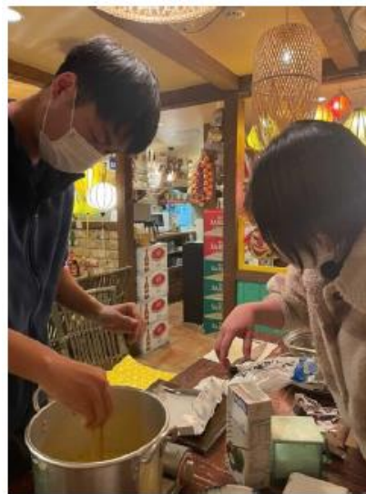
メニューの試作風景

2品は当初目標だった100食を完売し、そのうちのひとつは、メニューとして存続が決まりました。