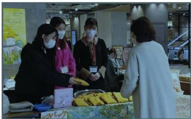
染色した エコバッグ

学生たちは野菜の廃棄部分に着目し、染物屋と協働して、廃棄される玉ねぎの皮を染料に加工し、染色したエコバッグを作成しました。作成後、学生たちはイコットニコットでエコバッグを販売しました。