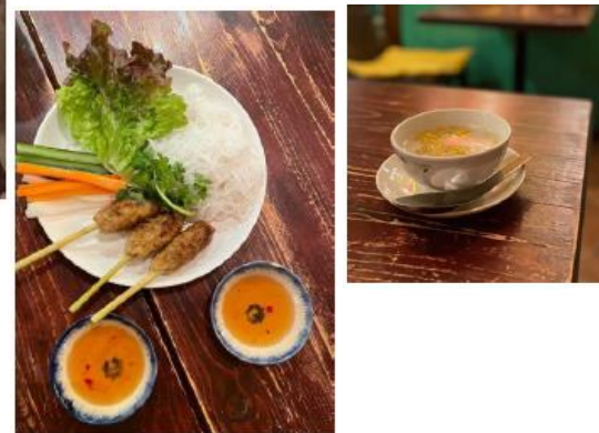
開発したメニュー