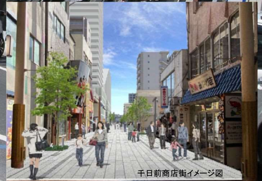
千日前商店街イメージ図