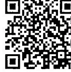
戦国BANASHI 歴史体験VR 実体験編 （7月1日17:00アップ）