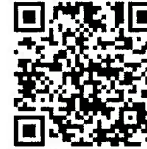
戦国BANASHI 備中高松城址ロケ編 （7月1日17:00アップ）