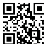
御墳印を集めるんじゃ 特設サイト