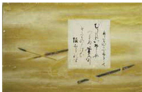
池田光政の和歌の書(岡山城蔵) 「むかしよりかけどもつきぬ筆のあと すずりのよはひ限しられず」