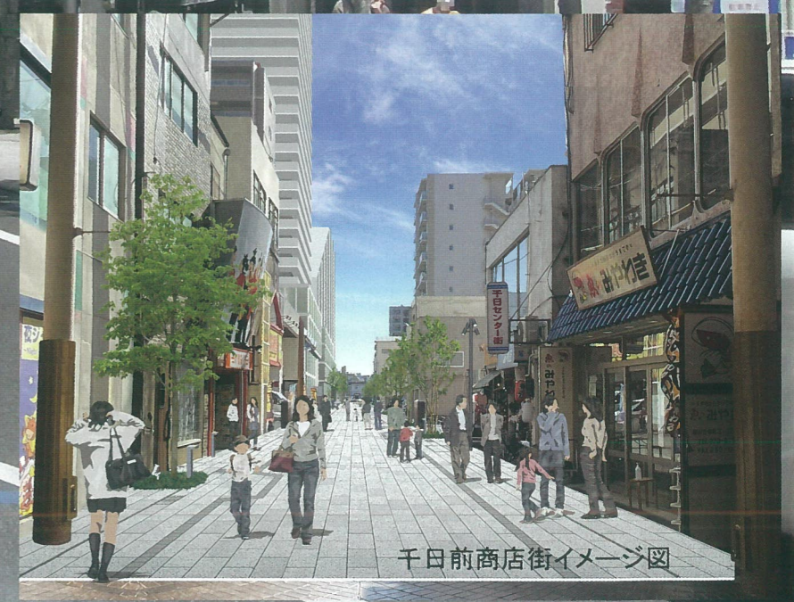
千日前商店街イメージ図