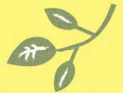
illustration by フジワカマリ

同じ立場を経験しないとなかなか共有できない悩み・想いを、 シェアしあいながら一緒に解決していきましょう。