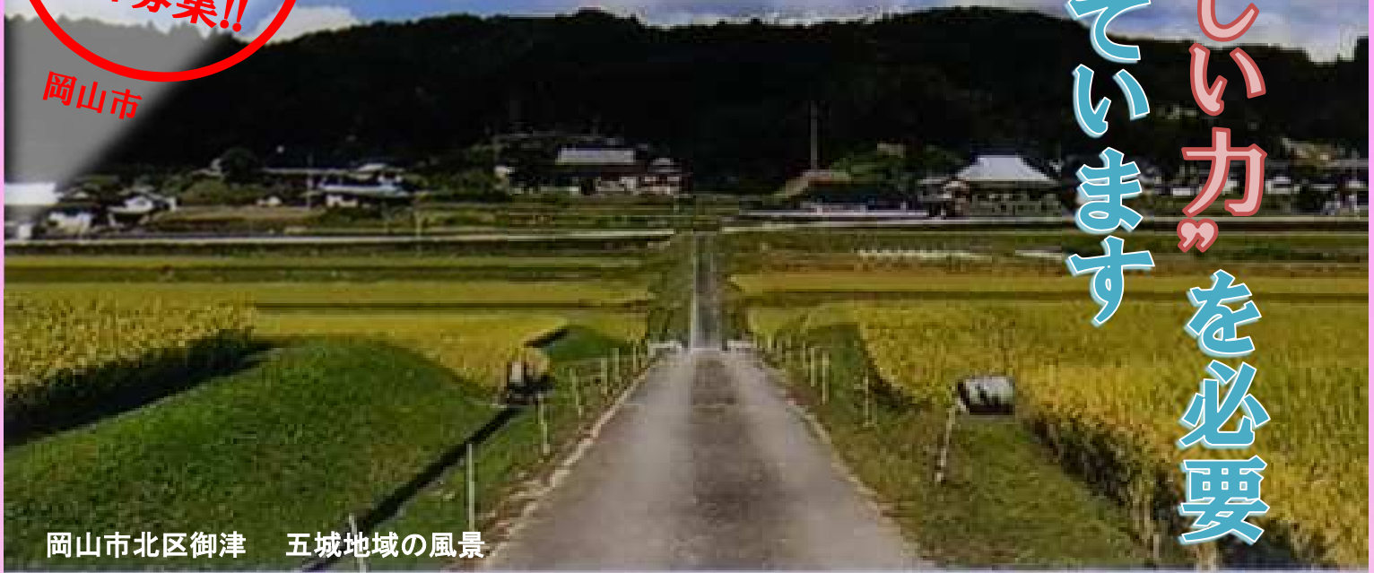
岡山市北区御津 五城地域の風景