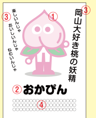
（例）A4 版 記入参考