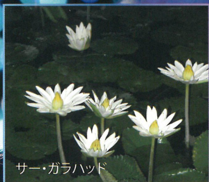
サー・ガラハッド