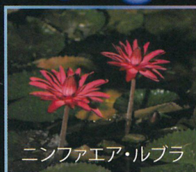
ニンファエア・ルブラ