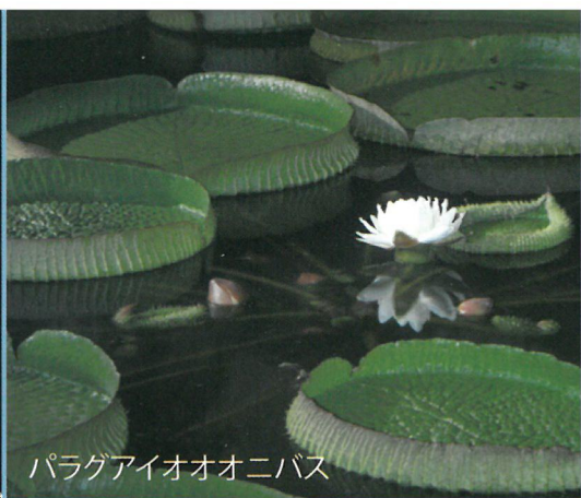
パラグアイオオニバス