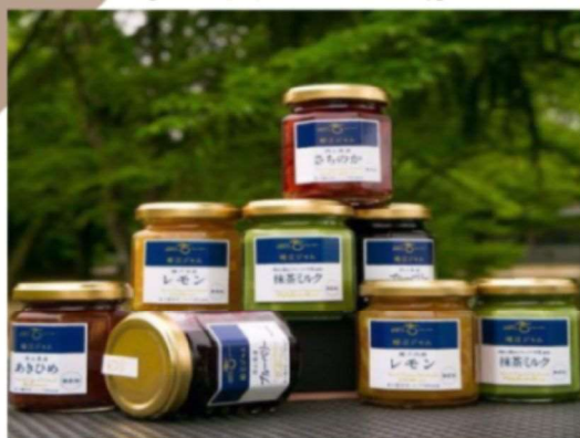
手づくりジャム工房

事務所：岡山県岡山市中区高屋215-1 オンライン公式通販： https://jam-kobo.com