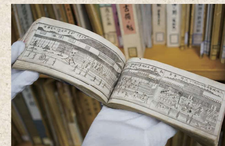
市街中心部の商店を掲載した資料「山陽吉備之魁」(明治16年)

2階の郷土資料コーナーでは、岡山に関する郷土資料を網羅的に収集、整理、保存。新聞記者で俳人の西村燕々が秘蔵していた郷土俳諧誌や句集をはじめ、貴重な資料が数多く収められています。