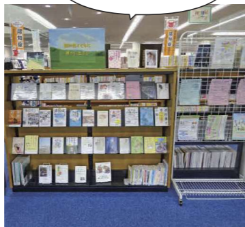
中央図書館の企画展示の様子

館内では、季節や時事に合ったテーマの本を集めて展示を行っています。市を拠点とするスポーツチームや学校と連携することもあります。現在、中央図書館では「認知症とともに豊かに生きる」について展示中。今後は、「岡山芸術交流2022」との連携展示や絵本の原画展などを予定しています。