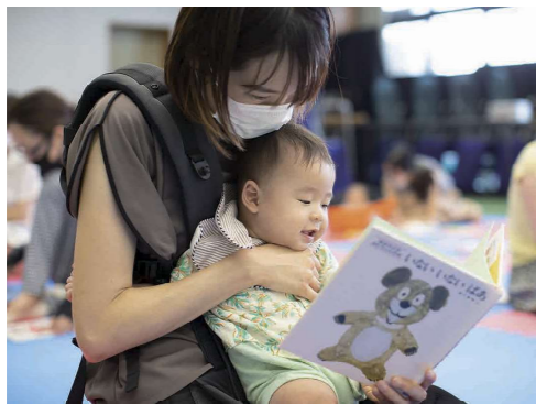
中央図書館で行われた「絵本読み聞かせ」のイベントの様子。この日のテーマは「おと、オト、なんの音?」

図書館職員やボランティアによる絵本の読み聞かせや紙芝居、ふれあい遊び、紙芝居、人形劇、腹話術などを楽しめます。