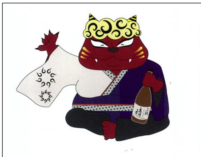
↓【入賞4】晴福神(はれふくじん)