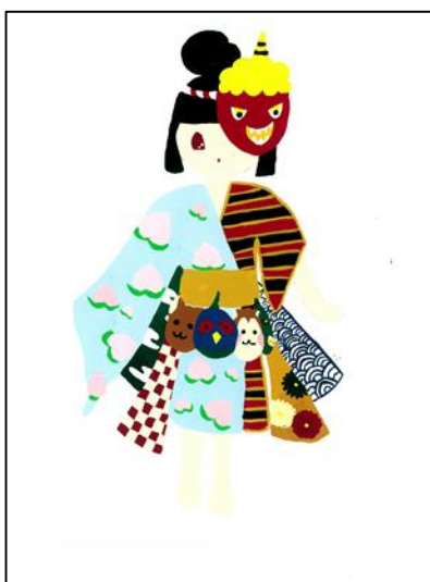
↓【入賞5】桃鬼っこ(ももおにっこ)