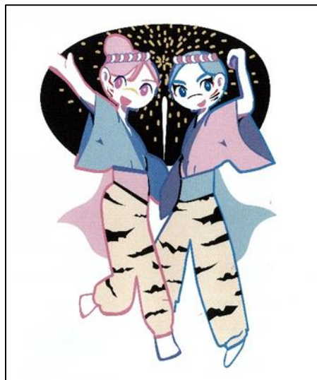
↓【入賞2】わたやんとあめやん