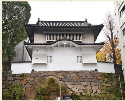
国の重要文化財である岡山城 西丸西手櫓