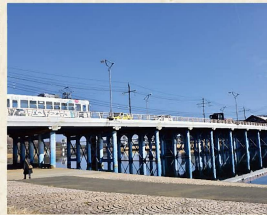
旭川にかかる現在の京橋