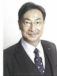
城郭考古学者 千田嘉博教授 (奈良大学)