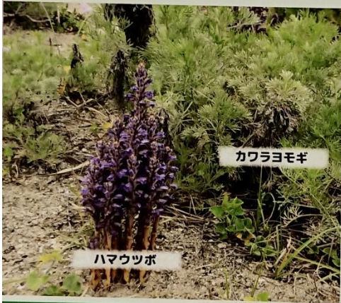
ハマウツボ Orobanche coerulescens (ハマウツボ科 ハマウツボ属)

ハマウツボは、成長に必要なすべての養分をほかの植物からもらう「寄生植物」です。おもにキク科ヨモギ属の植物に寄生し、このような砂地の場所では、特に、カワラヨモギという植物の根に寄生しています。4～5月ごろ、白い毛におおわれた10～25cm程度の黄土色のくきの上部にむらさき色の花を多数さかせます。花がさいた株は種子を作ったあと、かれてしまいます。