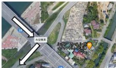
永安橋東の信号を右折する

「永安橋東」交差点を南(河口方向)に入り、吉井川堤防上の道路を約 70m 進む。 → 緑のポールがある下り坂を吉井川河川敷(堤防下)に降り、南へ 250m