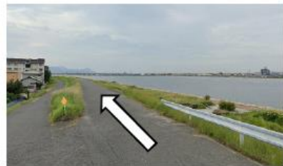
土手沿いを河口方向へ走る