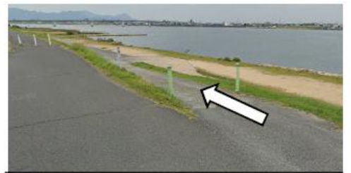
緑のポールがある道を下り河川敷へ