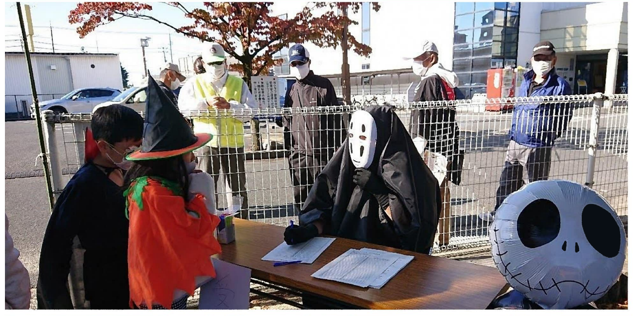
事例発表者「さい子ども会」の活動の様子