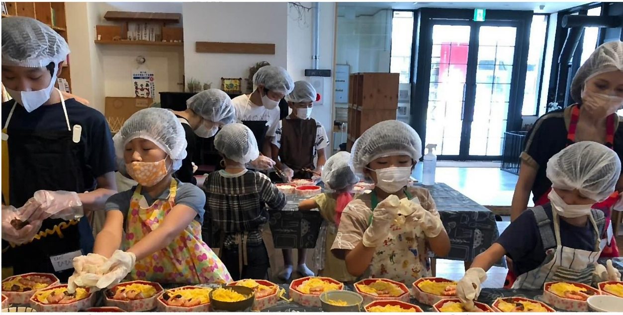
事例発表者「くらしのたね」の活動の様子