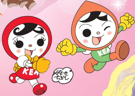
人権イメージキャラクター 人KENまもる君 人KENあゆみちゃん