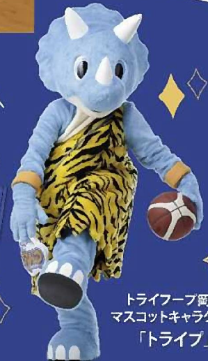
トライフープ岡山 マスコットキャラクター 「トライブ」