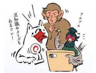
おかやまレキタビキャラクター