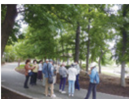
A 公園の植物みてあるき