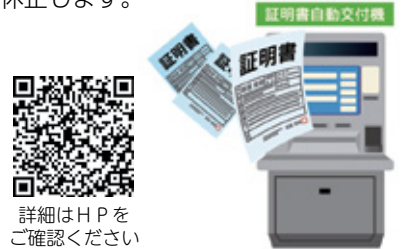
詳細はHPをご確認ください

☎ 区政推進課 ☎086-803-1033 1月21日(土)は、システムメンテナンスのため、天満屋地下街市民サービスコーナーを臨時休業します。 また、証明書自動交付機・コンビニエンスストアなどでの証明書交付も同日休止します。