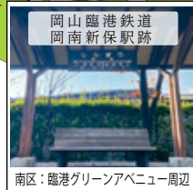
南区：臨港グリーンアベニュー周辺