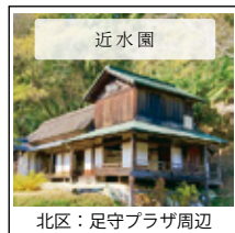
北区：足守プラザ周辺