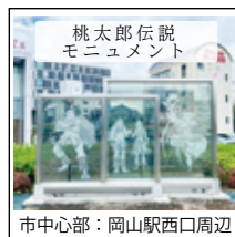
市中心部：岡山駅西口周辺