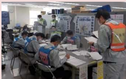
コントローラー（訓練を仕掛ける側）