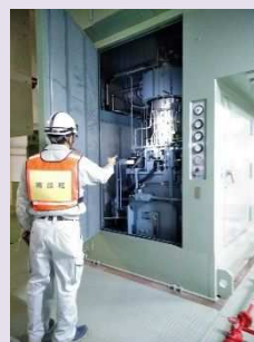
処理場・ポンプ場の被災調査