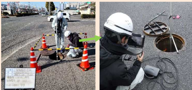
管路被害の測量調査