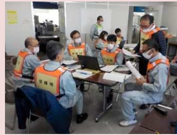
プレイヤー（訓練を受ける側）