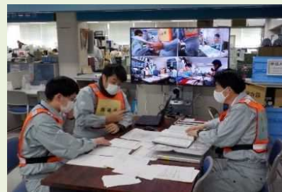
テレビ会議システムの活用