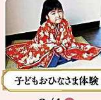
子どもおひなさま体験