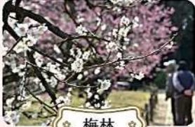
☆ 梅林 ☆