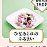
ひなあられの ふるまい