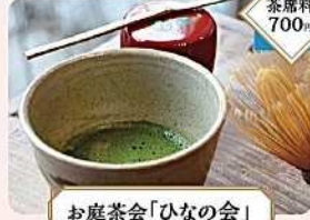
お庭茶会「ひなの会」