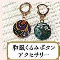
和風くるみボタン アクセサリ