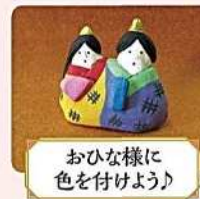
おひな様に 色を付けよう!