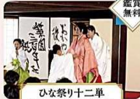
ひな祭り十二単 お服上げ(着付け実演)