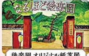
後樂園 オリジナル紙芝居