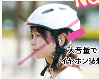
大音量でイヤホン装着