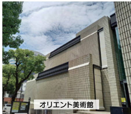
オリエント美術館

▲「館内の壁に注目です。人の手ではつられた風合いのある空間は見事です。自然光を取り入れたダイナミックな空間構成は、訪れた時間帯、季節によって雰囲気が変わり素敵です。」