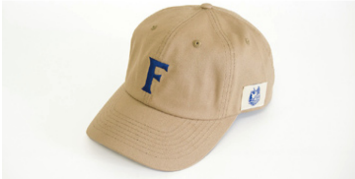
小学生以下限定来場者プレゼント