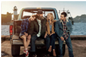
© 2020 VENDOME PICTURES LLC, PATHE FILMS