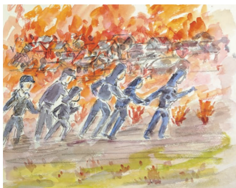
「人絹道路を南福島方面に逃げる人々」 山本英子作 2018年

岡山市の場合は1945年6月29日に大規模な空襲を受け、当時の市街地の63%を焼失し、少なくとも1737人*の死者が出ました。(*2000人をこえるという説もあります。)