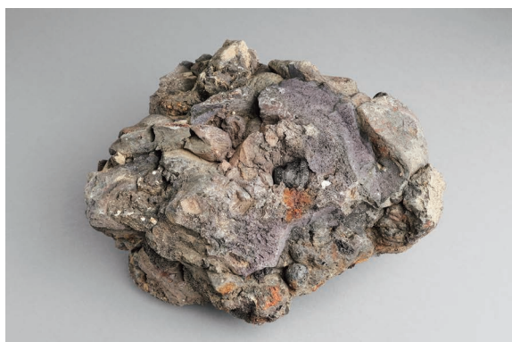
岡山城改修時に出土した、焼け溶けた瓦の塊