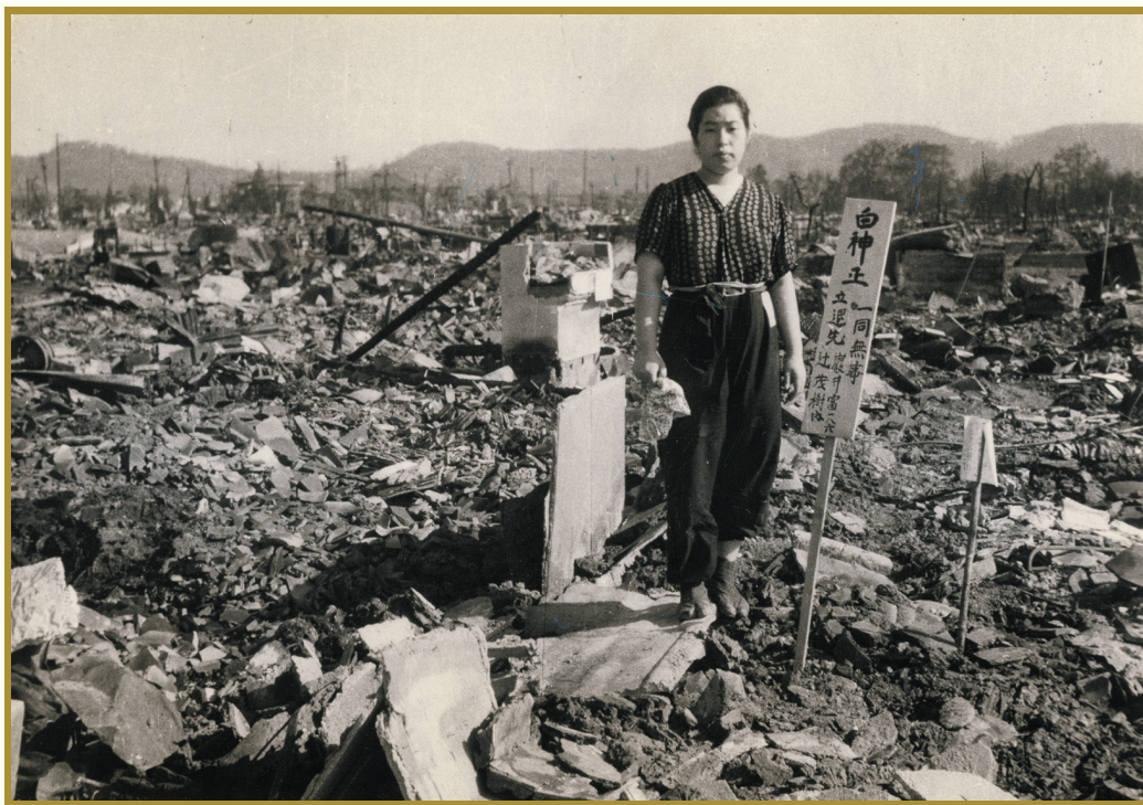
「疎開先を知らせる札とともに自宅の焼け跡に立つ女性」(場所不明) 1945年