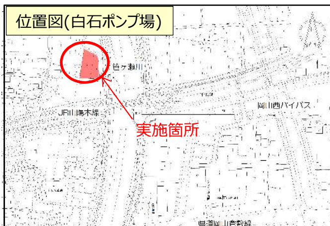
位置図(白石ポンプ場)